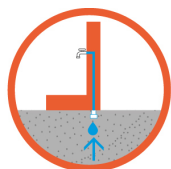
Fontaine borne, raccord en-dessous